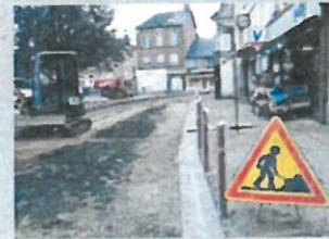
En cours de travaux.