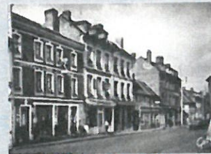
Dans les années 1960.