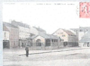
Il y a quelques temps déjà...

Un rappel : ce parking du centre-bourg sera en zone bleue 1 h 30 pour permettre aux clients des boutiques riveraines de pouvoir stationner non loin des commerces.